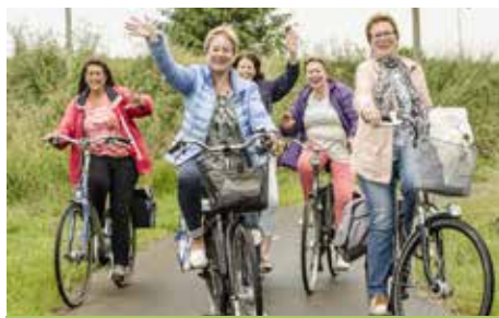
4. Golden Girls